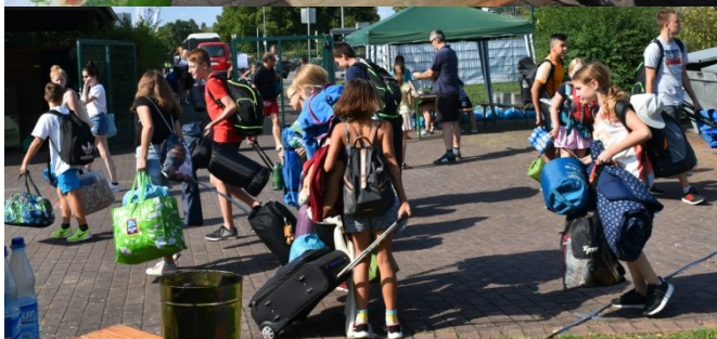
Ankunft der SWIM IN-Teilnehmer 2019 im Safari-Camp des Gießener Freibades Ringallee.