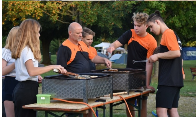
Die Grillstation wurde rege genutzt.