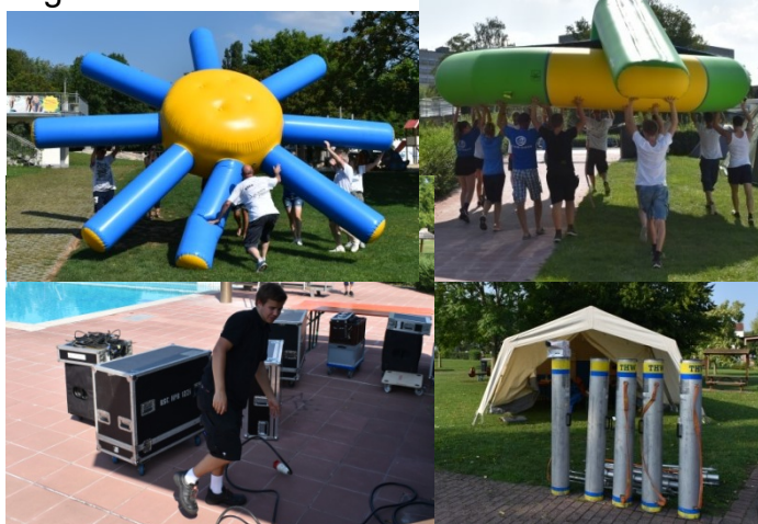
Krakenreparatur und gemeinsames Mitanfassen – so gelangten die Sachen in den Pool.